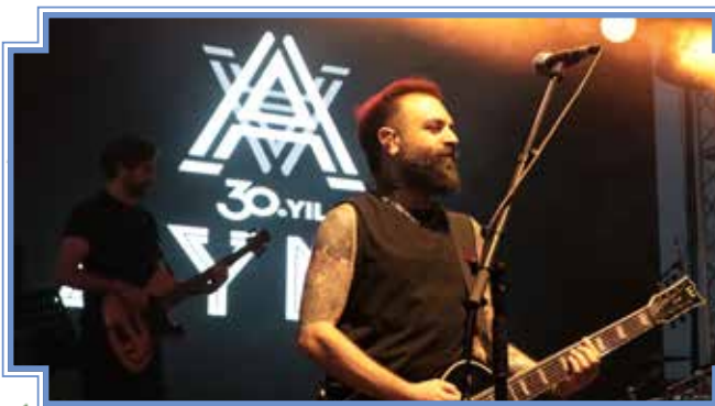
Haber: Fatma Tekin Kameraman: İsmail Orhun Koç