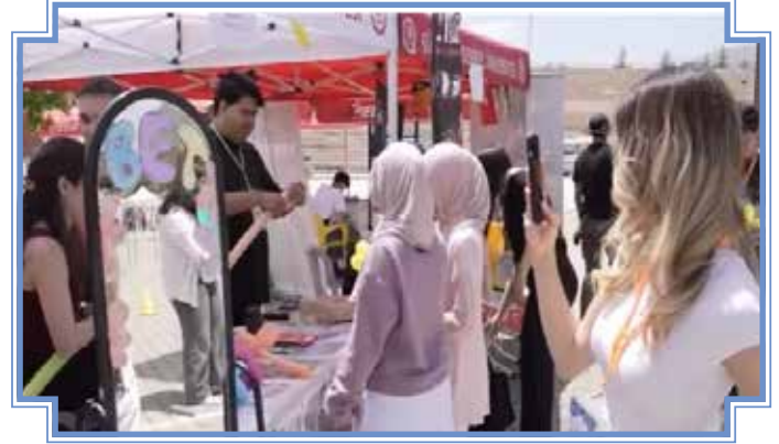
Haber: Fatma Sude İlhan

Şenliğe katılan öğrenciler, bu yılki organizasyonun önceki yıllara göre daha kapsamlı ve daha hareketli geçtiğini ifade etti. Gün boyu süren etkinlikler ve yoğun katılım, kampüste tam anlamıyla bir festival havası oluşturdu. Akşam saatlerinde gerçekleştirilecek konser öncesinde öğrenciler stantları gezme ve etkinliklere katılmaya devam etti. Süleyman Demirel Üniversitesi 19 Mayıs Öğrenci Meydanı'nda kurulan stantlar gün boyunca ziyaretçilerini ağırlarken, yarışmalar, atölyeler ve sosyal etkinliklerle Bahar Şenlikleri'nin ikinci günü dolu dolu geçti.